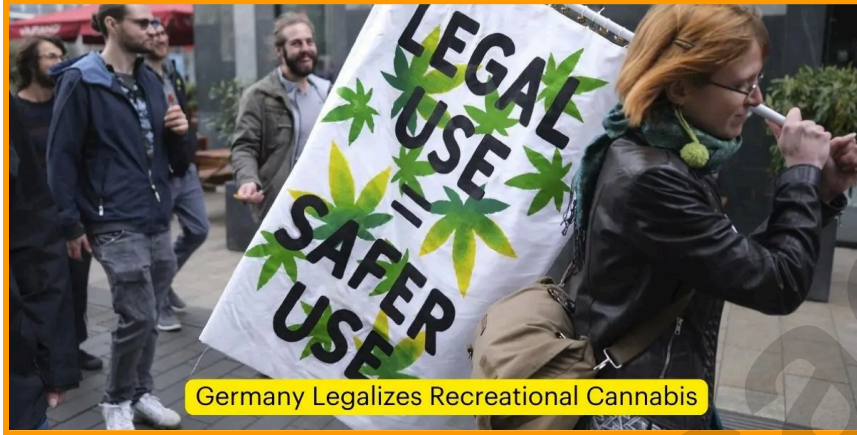
Germany Legalizes Recreational Cannabis

1 अप्रैल, 2024 को, राजनेताओं और चिकित्सा संघों के विरोध का सामना करने के बावजूद, जर्मनी मनोरंजक भांग के उपयोग को वैध बनाने वाला सबसे बड़ा यूरोपीय संघ (ईयू) देश बन गया। नए कानून के तहत, 18 वर्ष से अधिक उम्र के वयस्कों को अब 25 ग्राम तक सूखी भांग ले जाने और घर पर तीन मारिजुआना पौधों की खेती करने की अनुमति है।