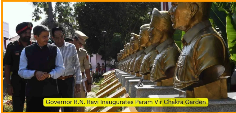
Governor R.N. Ravi Inaugurates Param Vir Chakra Garden

राज्यपाल आर.एन. रवि ने परमवीर चक्र गार्डन का उद्घाटन किया