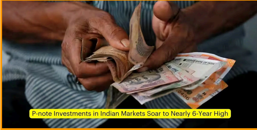
P-note Investments in Indian Markets Soar to Nearly 6-Year High

भारतीय पूंजी बाजार में पार्टिसिपेटरी नोट्स (पी-नोट्स) के माध्यम से निवेश फरवरी 2024 के अंत में 1.5 लाख करोड़ रुपये तक पहुंच गया, जो लगभग छह वर्षों में उच्चतम स्तर है। भारतीय इक्विटी, ऋण और हाइब्रिड प्रतिभूतियों सहित पी-नोट निवेश में यह उछाल घरेलू अर्थव्यवस्था के मजबूत प्रदर्शन से प्रेरित है।