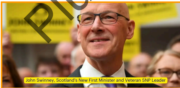
John Swinney, Scotland's New First Minister and Veteran SNP Leader

जॉन स्वाइनी, स्कॉटलैंड के नए प्रथम मंत्री और अनुभवी एसएनपी नेता